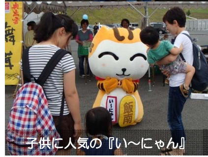
子供に人気の『い〜にゃん』