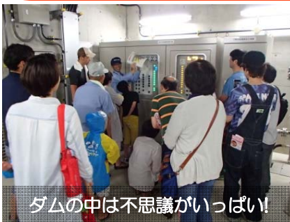
ダムの中は不思議がいっぱい！

巡視艇体験で巡視艇に乗り込んだ子供たちは嬉しそうに手を振ってくれました！これからも、このように楽しみながら少しずつダムに興味を持ってもらう機会を企画していきたいと思えます。雨の降る中、たくさんの方に来て頂きありがとうございました！