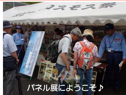
パネル展によこそ♪