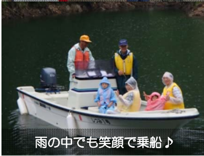
雨の中でも笑顔で乗船♪