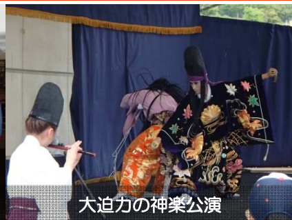
大迫力の神楽公演