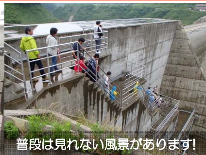
普段は見れない風景があります！