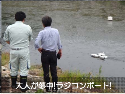
大人が夢中！ラジコンポート！