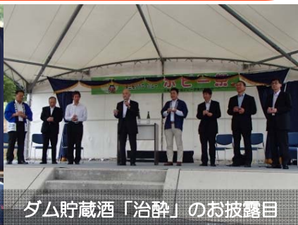
ダム貯蔵酒「治酔」のお披露目