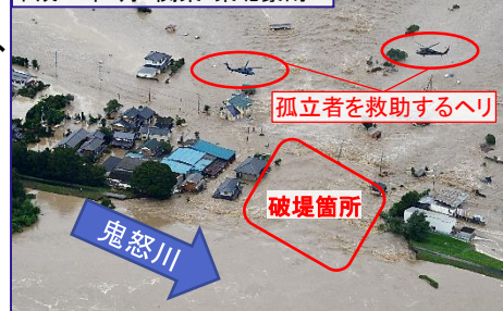
平成27年9月 関東・東北豪雨