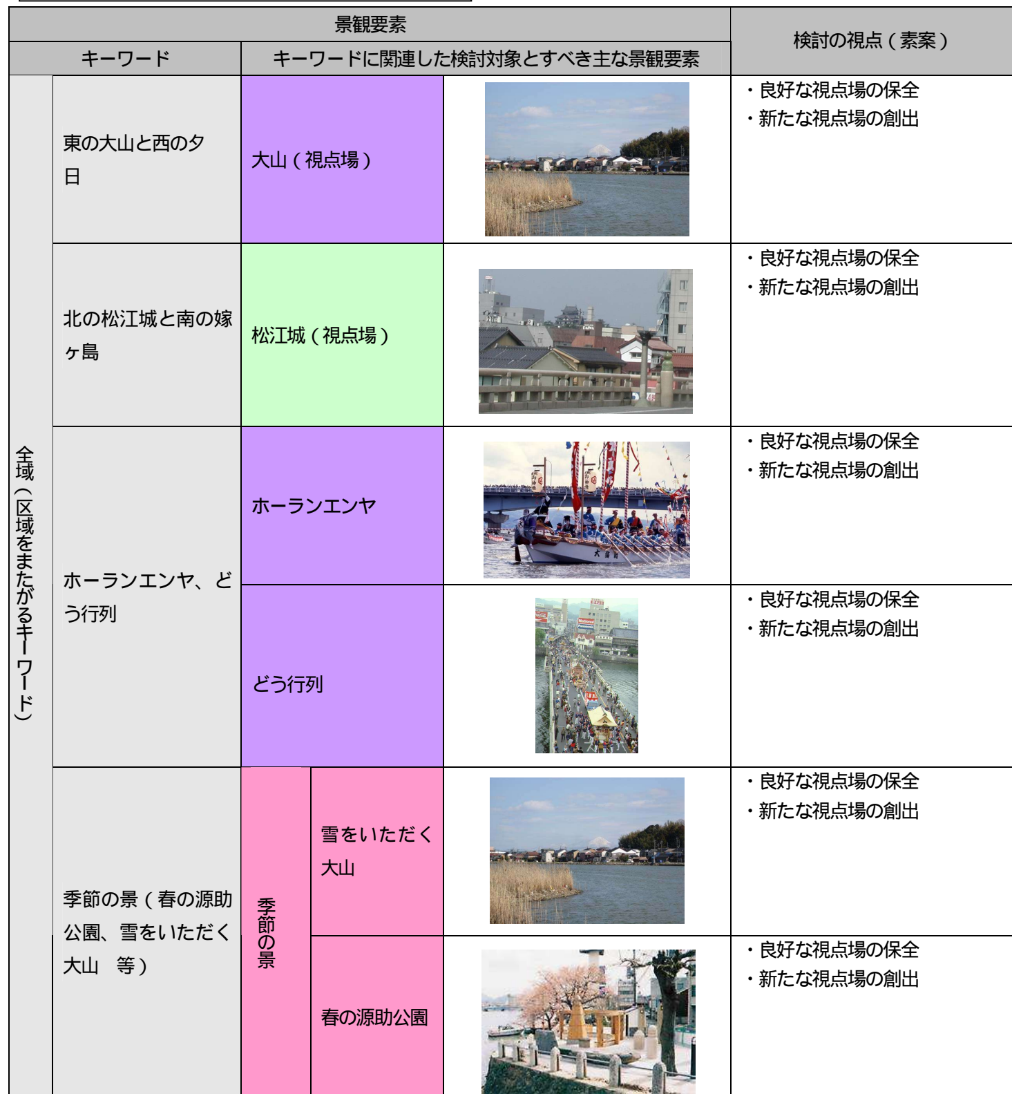
検討対象とすべき景観要素とその視点