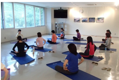
~尾原ダム管理支所でヨガをしている風景~

『Okutabi むふふオータム』の1プログラムとして、尾原ダムでヨガとカフェが開催されました。ダムでヨガとカフェなんて聞いたことありますか？ダムは関係者以外立ち入り禁止の場所ではなく、大自然で癒やしを感じることができる空間なんです。当日は、普段入ることのできないダム本体内部の見学も行われました。いつもは味わえない空間に、参加者は『遊園地にきたみたい！』『こんな大きな壁見たことない！』と驚きと興奮でいっぱいでした！