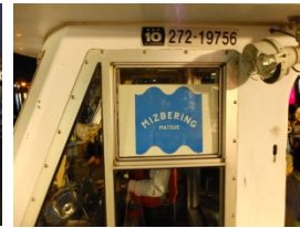
船にミズベリングロゴ！