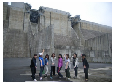
~ダムの見学しました☆~