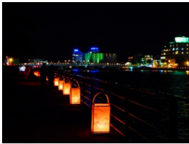
~大橋川を照らす行灯~

10月、松江の夜は「水燈路」が開催され、城下町を中心に幻想的な光に包まれます。3日、4日は松江市の社会実験として、市内を流れる大橋川周辺で様々な取り組みが行われました。大橋川沿いには行灯が設置され、導かれるように進むと乗船場に辿りつきます。大橋川には3つ乗船場が設置され、水上遊覧で川沿いの夜景が楽しめました。松江駅前乗船場、松江大橋南詰の源助公園にはオープンカフェが営業され、あたたかい飲み物、ビーフシチューなどをいただくことができました。たくさんの方が夜の水辺に集まった賑わいのある時間を過ごし、未来の松江の可能性を感じました。