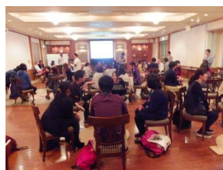
～ワークショップの様子～