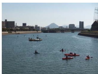
～スタンドアップパドルボードとカヌーの体験～

ミスベリングって、このような体験をするだけで自然と繋がっていくものなのかもしれません。