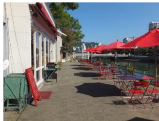
～京橋川沿いのオープンカフェ～

平和記念公園、原爆ドームに沿って流れる元安川沿いにもオープンカフェが設置されており、外国人観光客で賑わっていました。