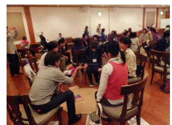
～水辺を語ると自然と和やかな雰囲気に～