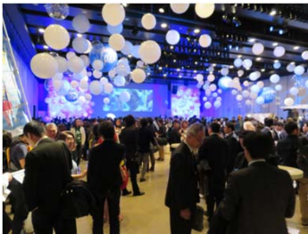
満員御礼の交流会