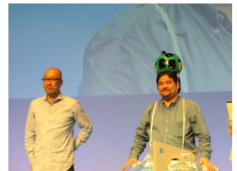
新キャラ！？トレッカーくん