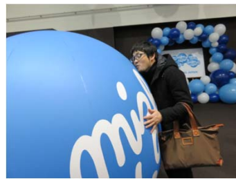
ミズベ愛が押さえきれず、ミズベバルーンにハグ！