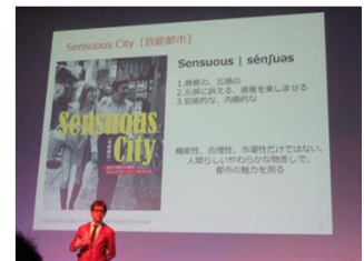
官能的な街づくりのために