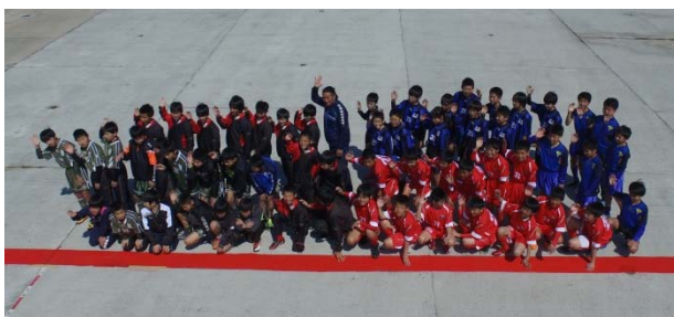
全員集合でヒーホーポーズ

http://www.cgr.mlit.go.jp/izumokasen/mizube/mizbering/hiho/hiho.html