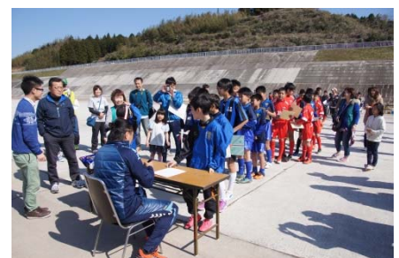
サイン会には長蛇の列