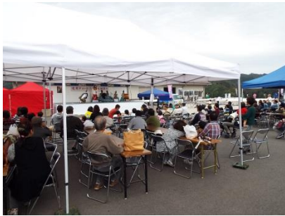
ステージを中心に賑わう会場

■10月16日(日)尾原ダムにて「さくらおろち湖祭り2016」が開催されました。ランバイク体験、ダム堤体見学、ボート体験会(レガッタ、カヤック)等催しが目白押し、会場は多くのお客さんと賑わっていました。飲食店も地元内外より多数出店されており、中には尾原ダム初となる「尾原ダムカレー」の販売もありました。ゲートからの放流に見立てられたエビフライが存在感抜群。もちろん味もばっちりでした。