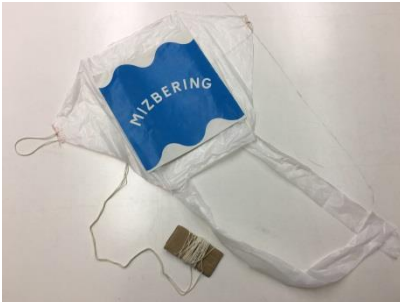
作成したミスベリング凧