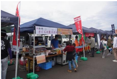
多数の飲食店が並びました