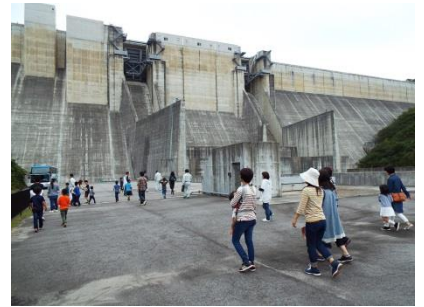
尾原ダム堤体見学