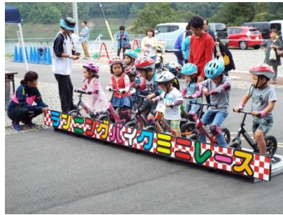
子ども達のランバイク体験会