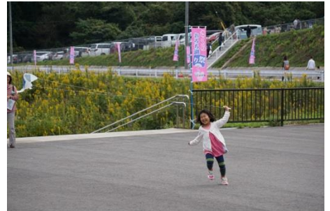
子ども達に楽しんで頂けました

■ミスベリング縁(えにし)に入って島根の水辺をもっと盛り上げよう。水辺が好きの人、楽しみたい人、新しいことにチャレンジしたい人などなど、お待ちしております。