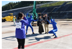
ブルーマンとの撮影会