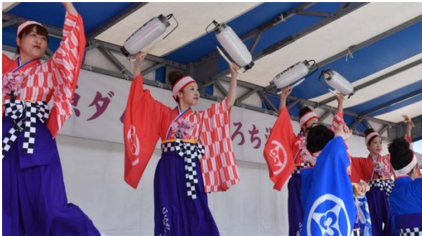
「ひらた踊らにゃSONSON」による、よさこい踊り

ミスベリング縁は毎年好評の「ぐにゃぐにゃたこ作り」ブースを出店。今年度は天気・風共に最高の風揚げ日和で、みんな上手に凧を空に泳がしました。今年度は特に大好評で常に満員御礼状態でした！