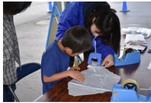
大盛況の凧作り・凧上げ体験