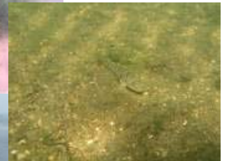
浅場整備(イメージ)