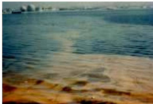
中海赤潮発生状況