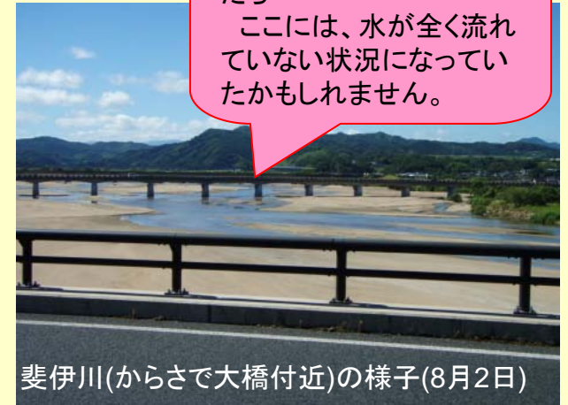
斐伊川(からさで大橋付近)の様子(8月2日)

もし、尾原ダムがなかったら…… ここには、水が全く流れていない状況になっていたかもしれません。