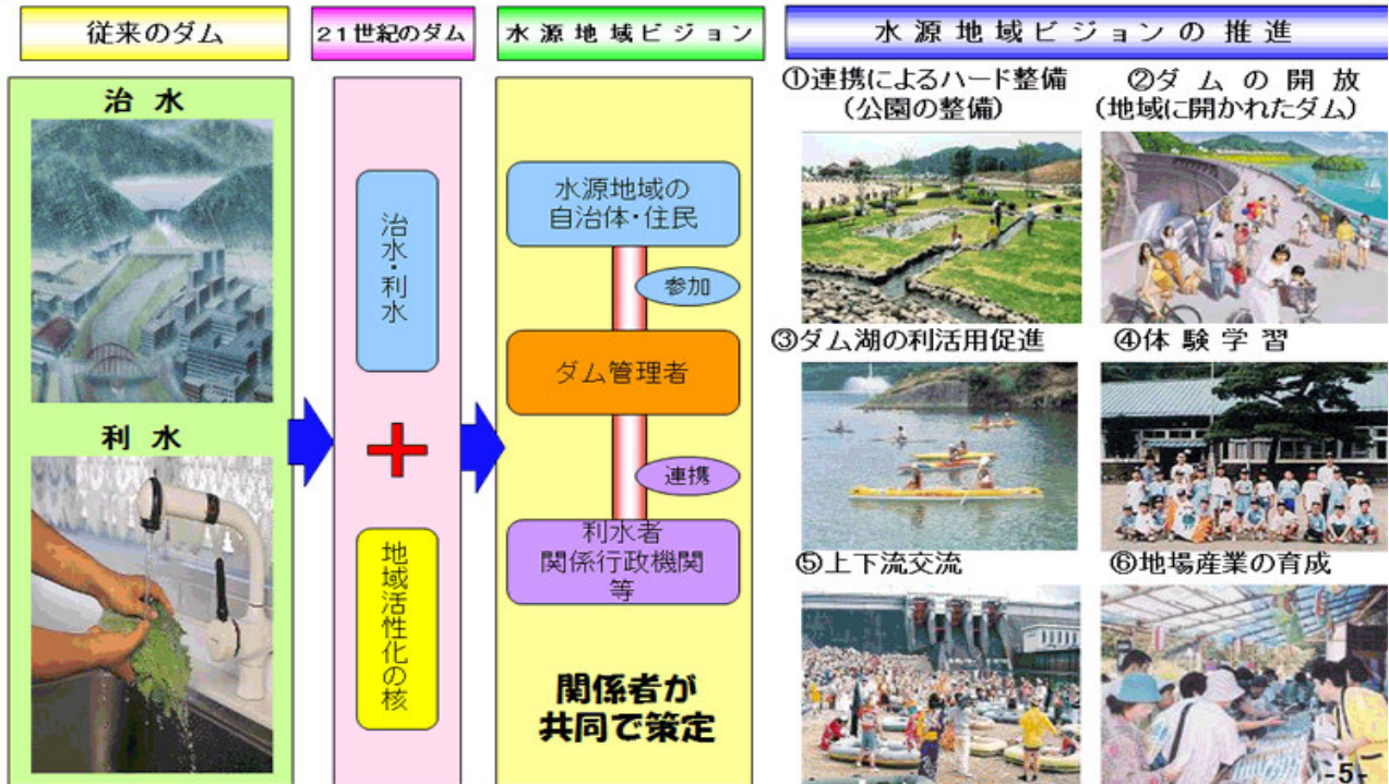
水源地域ビジョンのイメージ図

目的：水源地域及び流域自治体、住民及び関係行政機関が広く連携し、適切なダム管理及びダムを活かした水源地域の自立的、持続的な活性化を図る。