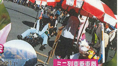
ミニ列車乗車券 1回 200円