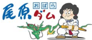
尾原ダムキャラクター「すさのおくん」