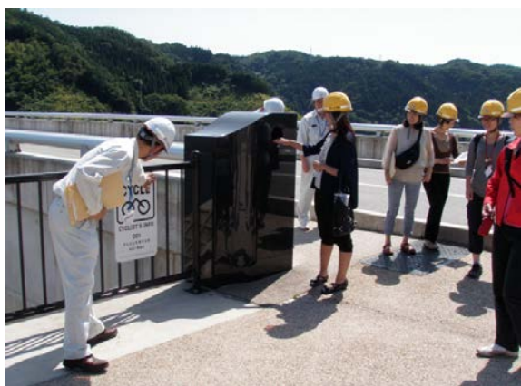
日本初 観光庁認定サイクリングコース