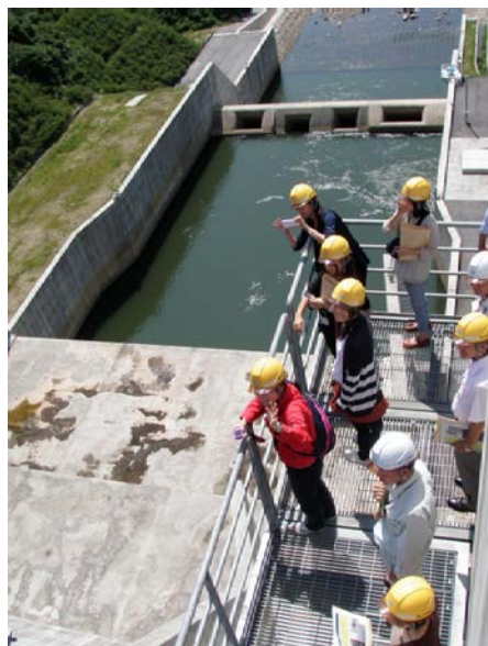
クレストゲート点検路