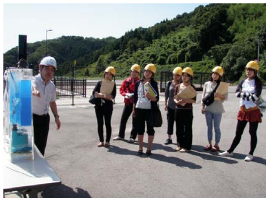
連続サイフォン式選択取水設備の模型