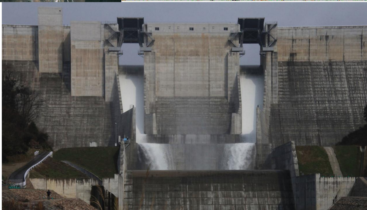
【写真】 昨年（平成25年3月2日）の点検放流状況 毎秒約10トン／2門 注）今回も昨年と同規模の毎秒10トン程度の放流を予定しています。