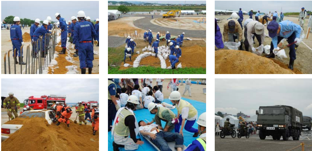
※写真は平成25年 千代川水防演習の実施状況です

日時：平成26年5月24日（土）9：00～12：30 （大雨等により参加機関が防災体制をとる必要がある時は中止する場合があります。）