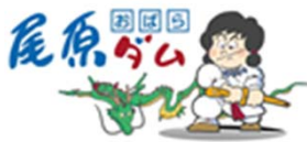
「すさのおくん」 尾原ダムキャラクター

※国土交通省出雲河川事務所では、ウェブサイトにて、河川の水位情報やダム情報を提供しておりますのでご覧下さい。