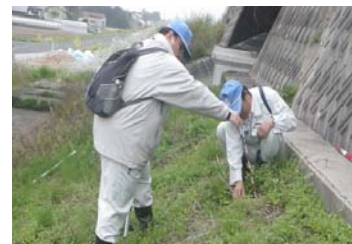
写真 H26 点検実施状況

出雲河川事務所管内では、今年も出水期に備え、河川の堤防や護岸・排水門及びダム湖周辺などの異常を確認し、現状の把握、応急的な措置をすることで堤防の決壊や漏水等を回避することで被害軽減を目的とした「斐伊川・神戸川の堤防一斉点検」を実施します。