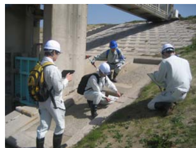
H27 出水期前点検実施状況