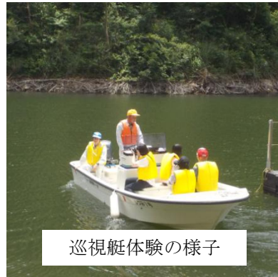
巡視艇体験の様子