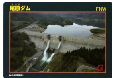
尾原ダムカード ver.2.0 (写真は昨年度のクレスト放流の様子です)

○ 尾原ダムファンクラブ Facebook http://www.facebook.com/cgr.mlit.obaradam