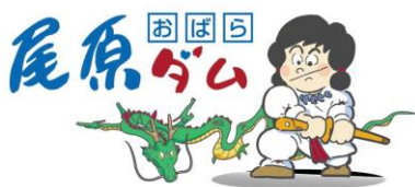
尾原ダムキャラクター「すさのおくん」