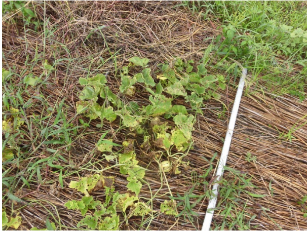
☆野菜畑での利用（無加工ヨシ）