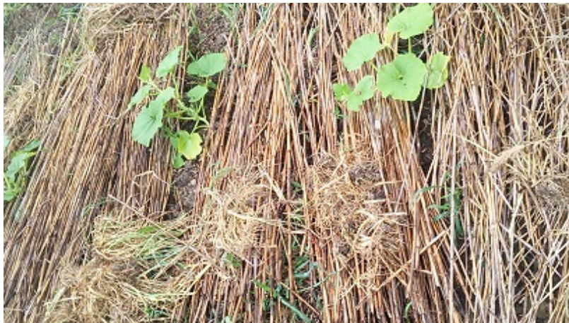
☆カボチャの畝での利用（無加工ヨシ）