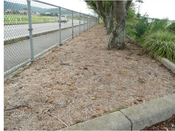
☆植栽まわりのマルチングとして（裁断ヨシ）