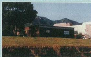
市民団体による活動拠点の整備事例（佐波川）