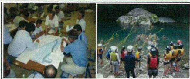
マイ防災マップづくり