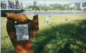
市民団体による看板設置事例（太田川）