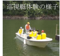
巡視艇体験の様子