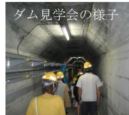
ダム見学会の様子