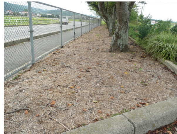
☆植栽まわりのマルチングとして（裁断ヨシ）