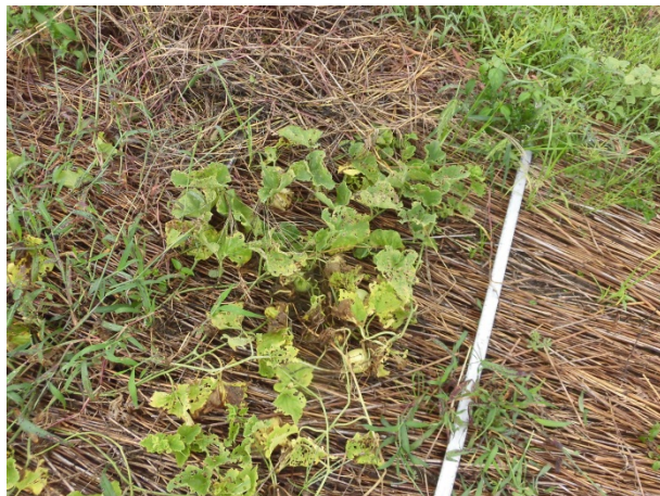
☆野菜畑での利用（無加工ヨシ）