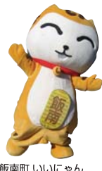
飯南町 いいにゃん