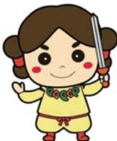
奥出雲町 すさのおくん