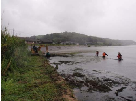
【出雲市鹿園寺町での回収状況】