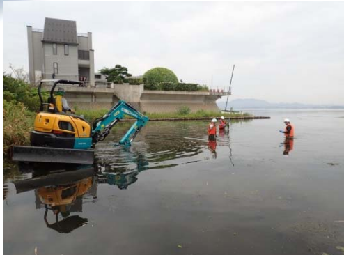
【松江市玉湯町での回収状況】