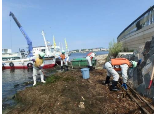
【白湯公園付近での回収状況】