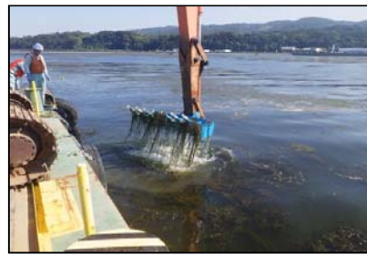
平成29年度刈り取り試験実施状況【バックホウ(スケルトンバケット)】

なお、例年と同様、沿岸域に漂着した水草等が腐敗することにより悪臭が発生したり、河川管理に支障が生じた場合は、回収作業を行う予定です。