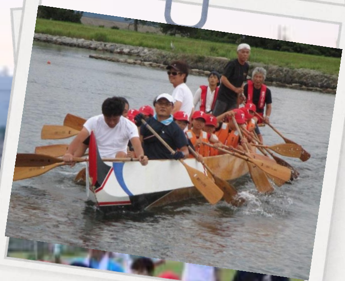
ボート・ペーロン体験乗船会! (予約不要・当日受付)