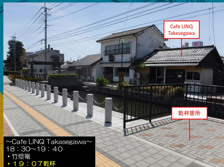
Cafe LINQ Takasegawa

なお、当日スタッフが配布する 専用コップを使用すれば、 Cafe LINQ Takasegawaにて飲み物と 購入することが可能です。