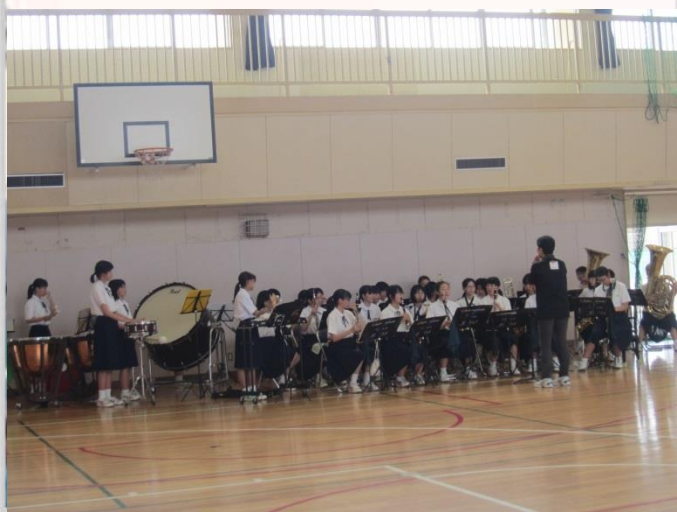
夕暮れミニコンサート (第二中学校吹奏学部)