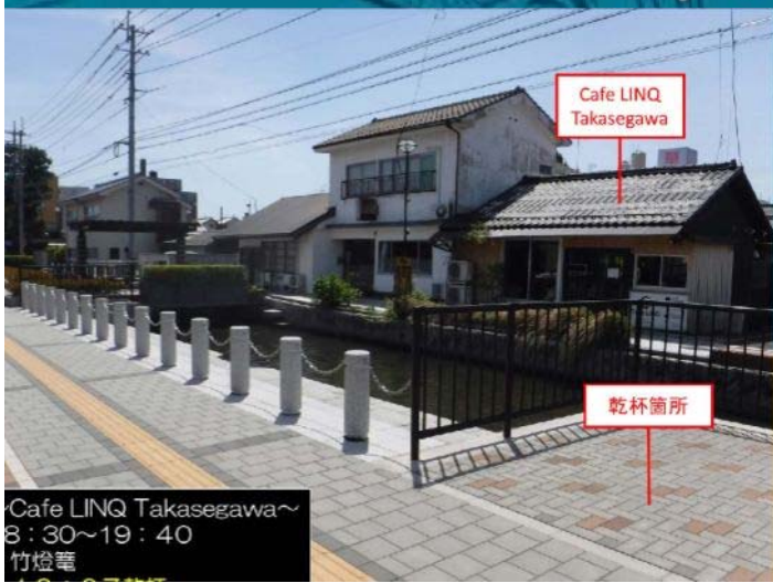
Cafe LINQ Takasegawa～ 8:30～19:40 竹燈篋

乾杯で使用する飲み物は、持参ください。 なお、当日スタッフが配布する専用コップと使用すれば、Cafe LINQ Takasegawaにて飲み物と購入することが可能です。