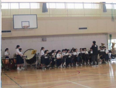
夕暮れミニコンサート (第二中学校吹奏学部)