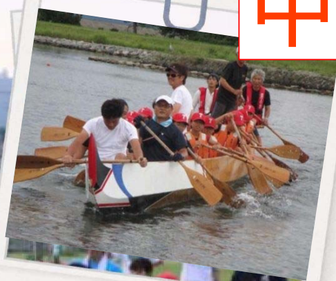
ボート・ペーロン体験乗船会! (予約不要・当日受付)