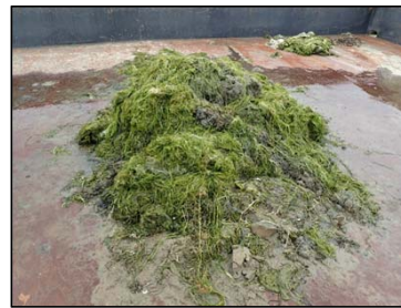
平成30年度6月期の刈り取り試験実施状況(写真左)と刈り取った水草等(写真右)

なお、例年と同様、沿岸域に漂着した水草等が腐敗することにより悪臭が発生したり、河川管理に支障が生じた場合は、回収作業を行う予定です。