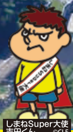
しまねSuper大使 吉田くん