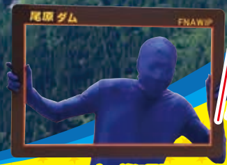
ブルーマンと一緒に尾原ダム川柳を詠んだり、 ダム式バンザイをしてみてくださいませんか?