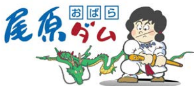
尾原ダムキャラクター「すさのおくん」