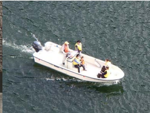
巡視艇体験の様子