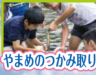
やまめのつかみ取り