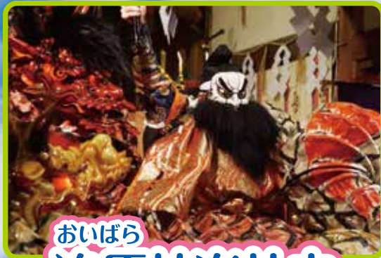
おいばら 追原神楽社中