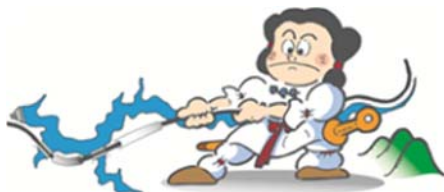
志津見ダムキャラクター「くにびきくん」

志津見ダム・大橋川改修事業パネル展示、降雨体験機による降雨体験、モデル撮影会、やまめのつかみ取りや飯南町特産品大抽選会などの様々なイベントの他、いのしし肉中華まんや奥出雲蕎麦、やまめの塩焼きやしまね和牛串焼きなどのうまいものコーナーもあります。