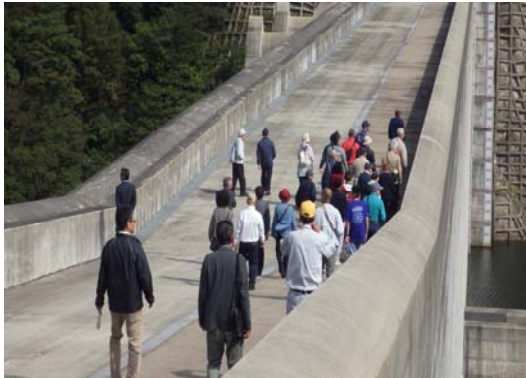
ダム見学会の様子