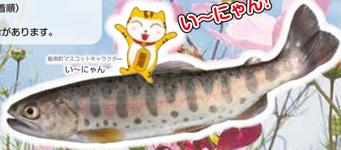
飯南町マスコットキャラクター い〜にゃん