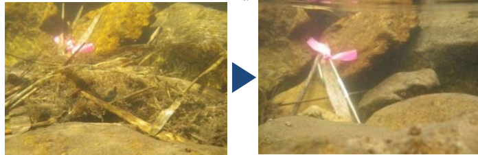
フラッシュ放流前