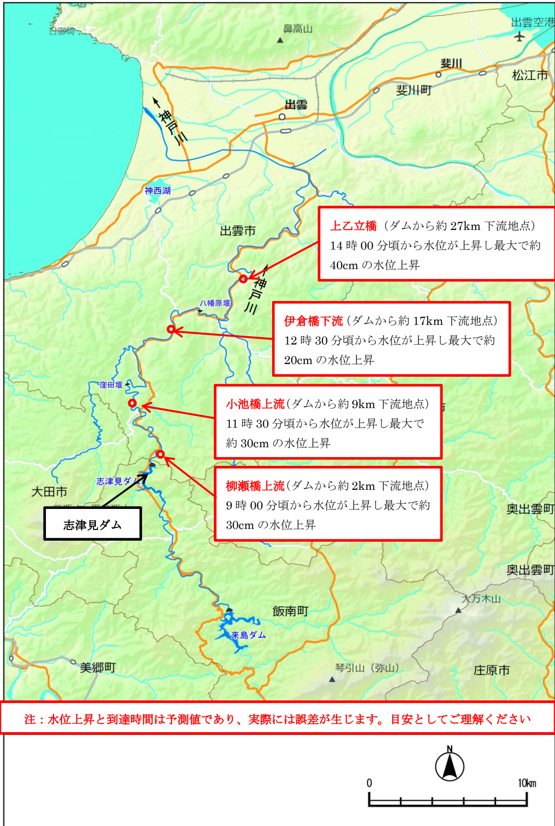
フラッシュ放流時の水位上昇・到達時間 (予測値)