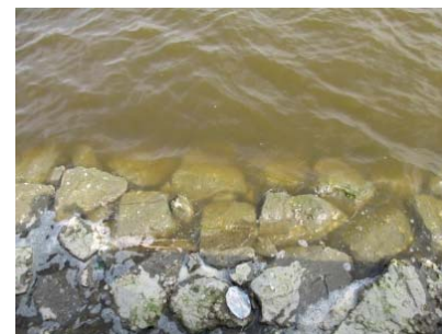
赤潮状況写真(安来干拓承水路)