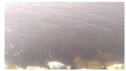
赤潮状況写真(彦名干拓から崎津港)