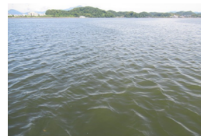
赤潮状況写真（米子港）