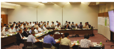
【第5回「大橋川周辺まちづくり検討委員会」の様子】

委員からは、「正確で詳細な情報発信を期待する」といった意見もあり、国・県・市では、引き続き速報値の精査やメカニズム等の検証を行い、情報提供していく予定です。