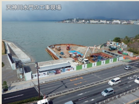
天神川水門の工事現場