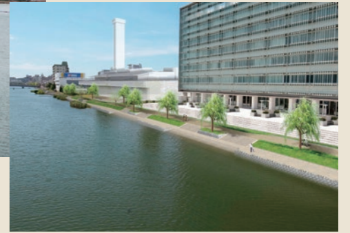
向島地区の護岸完成イメージ