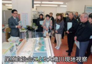
尾原自治会による大橋川現地視察

雲南市の尾原連合自治会の約30名が2月23日、松江市の大橋川コミュニティセンターを訪れ、大橋川改修事業の役割や進捗状況、環境や景観の保全策について、説明を受けました。参加者の皆さんは、模型や標本などを使った説明に、熱心に耳を傾けていました。