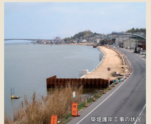
築堤護岸工事の状況