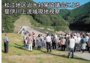
松江地区治水対策協議会による斐伊川上流域現地視察

大橋川の沿川にお住まいの方を中心にダム・放水路の視察が実施されています。また、上流部と下流部の特徴を活かした相互互恵の関係を構築していくとシンポジウムやイベント等が行われています。