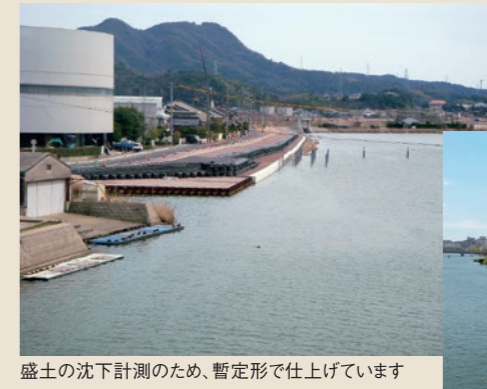
盛土の沈下計測のため、暫定形で仕上げています