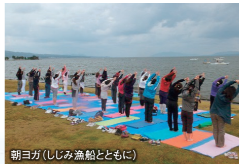
朝ヨガ(しじみ漁船とともに)