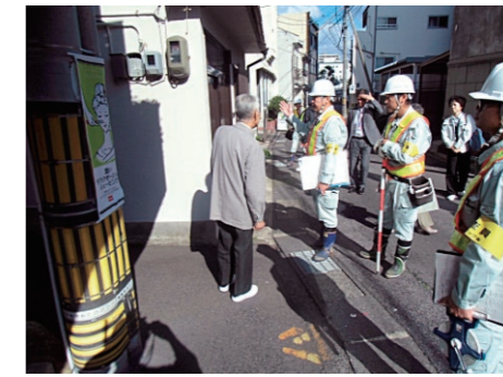
測量:(土地)境界確認の様子