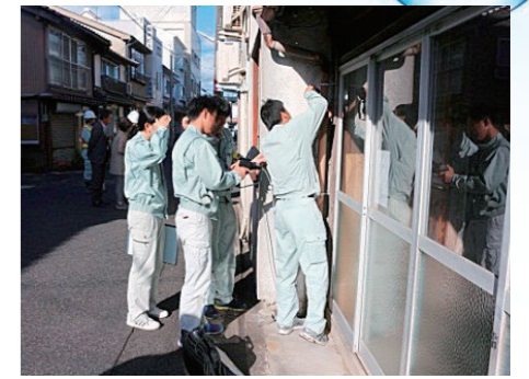
調査:物件(建物等)調査の様子