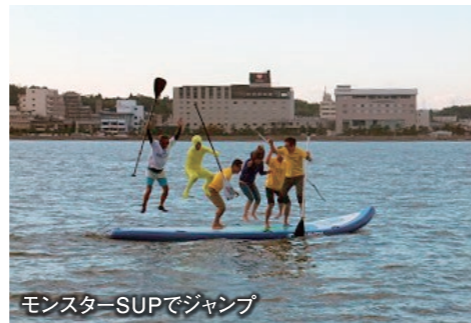
モンスターSUPでジャンプ