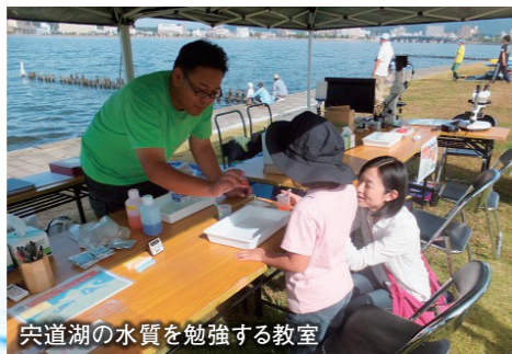
宍道湖の水質を勉強する教室