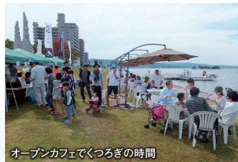
オープンカフェでくつろぎの時間