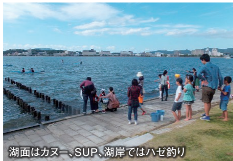
湖面はカヌー、SUP、湖岸ではハゼ釣り