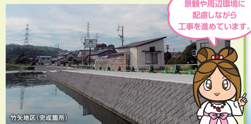
竹矢地区(完成箇所)

平成23年度に地元設計協議に着手し、平成25年度から築堤護岸工事を行っています。また、下流の井手・馬潟地区では平成24年度から護岸整備を行っています。