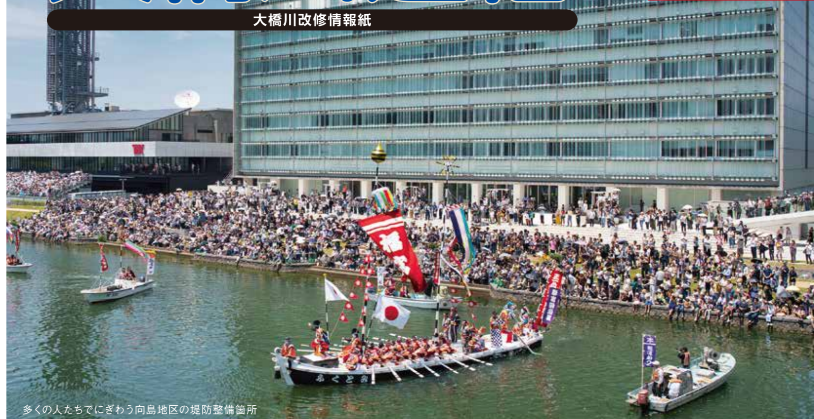
多くの人たちでにぎわう向島地区の堤防整備箇所