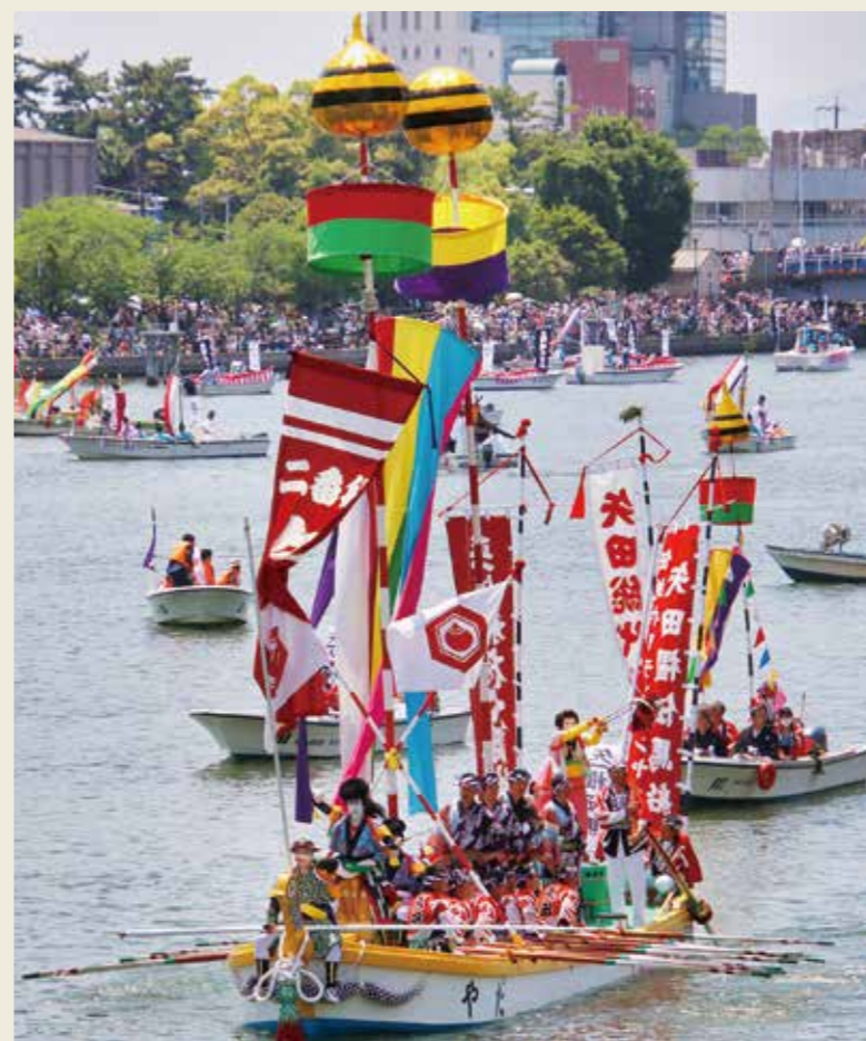
観客を魅了する権伝馬船

水都・松江が全国に誇る日本三大船神事の一つ「ホーランエンヤ(松江城山稻荷神社式年神幸祭)」が令和元年5月18日～26日にかけて、大橋川などを舞台に10年ぶりに行われました。