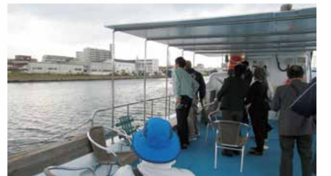
城東地区治水対策協議会の船上視察（令和元年10月29日）

参加された皆さんからは船上からの視察により、「普段は見る事ができない視点から大橋川を確認することができ、事業への理解が深まった。」との感想をいただきました。