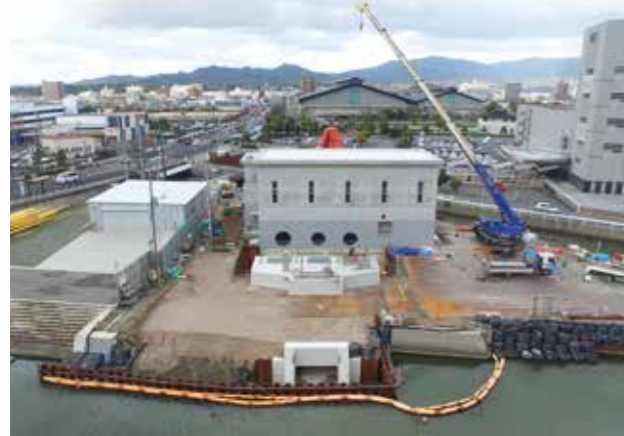
上追子排水機場工事状況（令和2年1月撮影）

上追子排水機場は平成28年より工事に着手し、現在は排水函渠、排水機場建屋の工事を行っています。令和3年度完成を目指して工事を進めています。