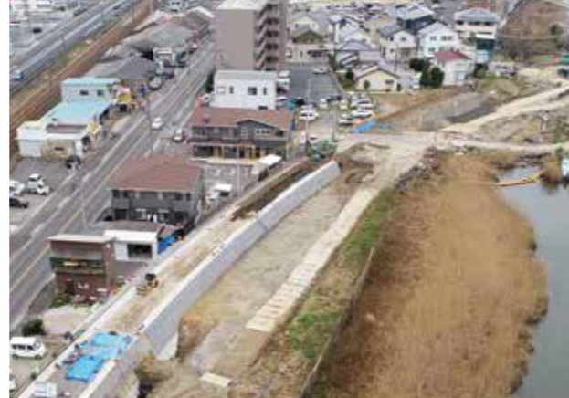
東津田地区工事状況（令和2年1月撮影）