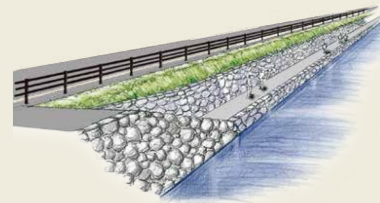
朝酌矢田地区の築堤護岸イメージ