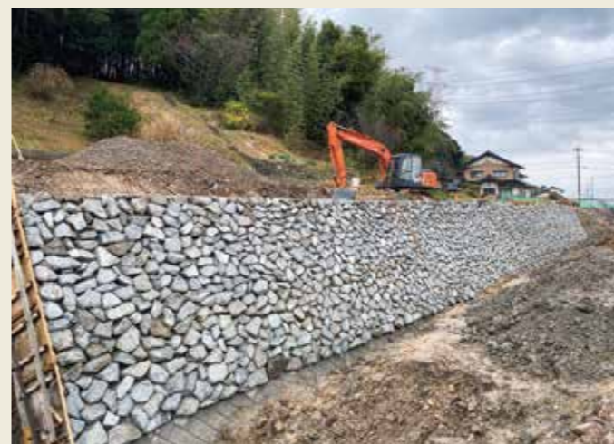
石積護岸工事状況 (令和2年1月撮影)

令和元年9月に開催した「第15回大橋川景観アドバイザー会議」では、朝酌矢田地区の護岸は自然石による石積護岸を基本とするとともに、現在の景観に配慮した素材として、他の工事で発生した「島石」も使用することが、決定されました。