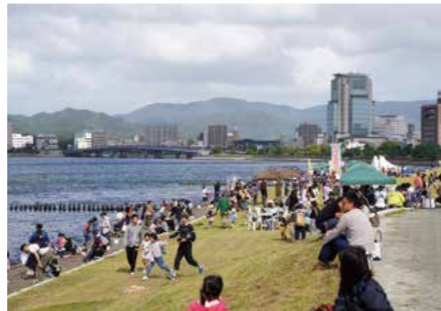
ミズベリング縁日の様子