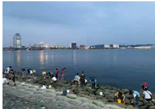
エビとり体験会の様子

今後もこうしたイベント等による宍道湖・大橋川の水辺とまちの賑わいづくりに取り組んでいくとともに、水都松江ならではの水辺の良さを感じられるような利活用について考えていきたいと思っています。