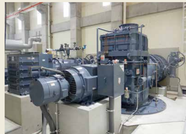
島根県新設ポンプ (5.0m 3 /s: 令和2年5月撮影)

松江市の橋北地区は松江城や島根県庁・松江市役所などがある歴史・文化・観光・生活の拠点です。しかし、地盤高が低く、洪水時の排水不良(松江堀川→大橋川(剣先川))により、度々、浸水被害にあっています。そこで、大橋川の堤防整備(国土交通省)に併せ、排水機場の能力を5.4m 3 /s(松江市)から10.4m 3 /s(島根県5.0m 3 /s追加)に向上させることにしており、令和2年6月に7.7m 3 /sの暫定整備が完了しました。今年度末予定で2.7m 3 /sの追加整備も行います。今後、松江市が洪水時に適切な操作を行い、橋北地区の浸水被害軽減に努めていきます。