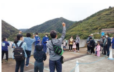
コスモス祭(約6,300人) 志津見ダムなどに関するO×クイズを実施