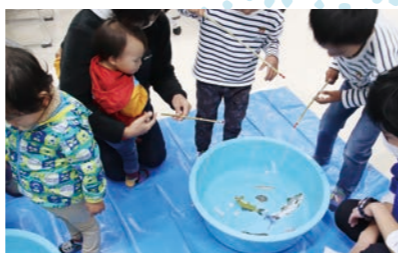
放水路記念館まつり(約1,400人) 宍道湖七珍にちなんだ魚釣りを実施