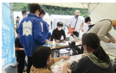
さくらおろち湖祭り(約3,500人) ぐにゃぐにゃ風作りを実施