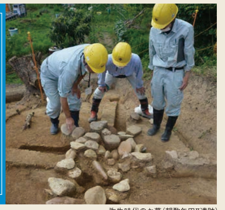
弥生時代のお墓(朝酌矢田II遺跡)