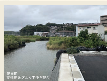
整備前 東津田地区より下流を望む