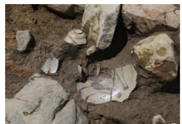
発見された唐津焼(松江城下町遺跡)

令和3年度より埋蔵文化財発掘調査に着手しました。今年度も引き続き埋蔵文化財発掘調査と用地協議を行います。