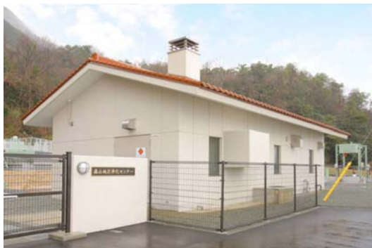
森山地区浄化センター