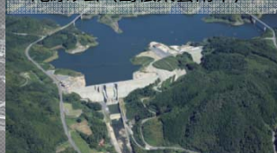
尾原ダム(島根県雲南市)