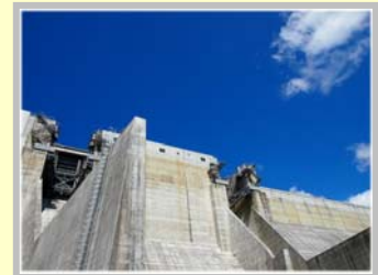
尾原ダム(島根県雲南市)