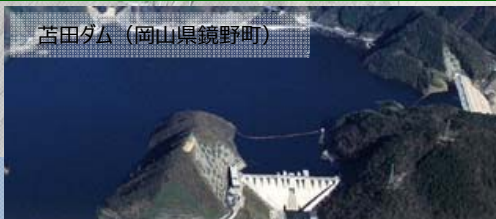
苫田ダム(岡山県鏡野町)