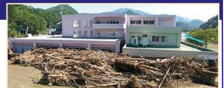
平成28年台風10号により、岩手県の要配慮者利用施設では利用者9名の全員が死亡。