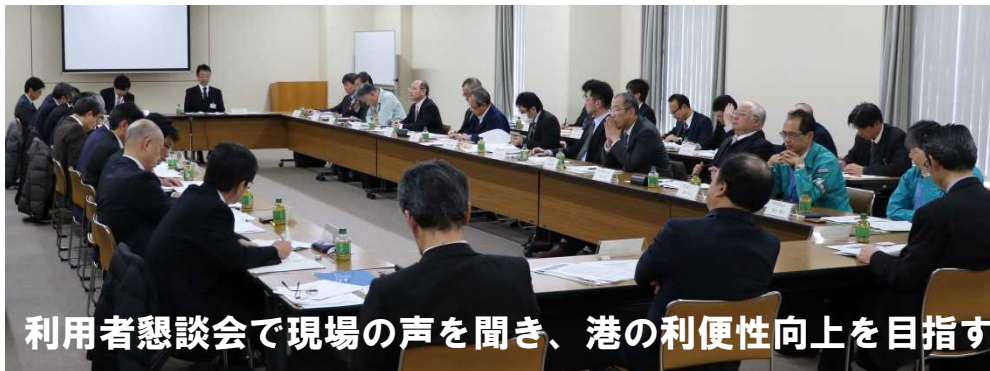
利用者懇談会で現場の声を聞き、港の利便性向上を目指す

地域の基幹産業を支える産業物流の効率化の推進。瀬戸内海側はもとより日本海側の拠点港としての機能強化。