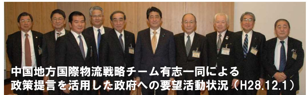
中国地方国際物流戦略チーム有志一同による政策提言を活用した政府への要望活動状況 (H28.12.1)